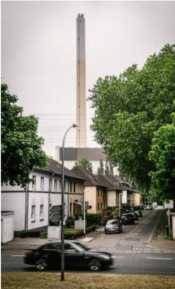
Blick in den Beisekampsfurth, der in unmittelbarer Nähe zur B224 liegt. Nach den Ausbau zur Autobahn sollen die Bewohner durch eine 4,50 hohe Lärmschutzwand geschützt werden.