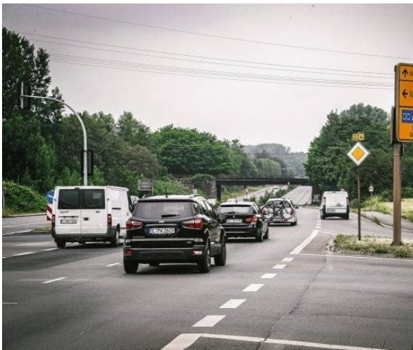
Die Gladbecker Straße hätte durch den Ausbau der B224 zwischen ein noch höheres Verkehrsaufkommen als schon bisher.

Dass das nicht genügt, zeigt eine Stellungnahme, die das Gesundheitsamt Essen zum geplanten A52-Ausbau abgegeben hat: Demnach treten gesundheitsgefährdende Stressreaktionen wie Blutdruckanstieg oder Beeinträchtigungen der Atmungs- und Herzfrequenz bereits ab Schallpegeln von 60 bis 70 Dezibel auf. Diese Stressreaktionen seien, so die Gesundheitsexperten, zusammen mit anderen Belastungsgrößen vor allem als Risikofaktoren für Herz-Kreislauf-Erkrankungen anzusehen. Bei Verkehrslärmpegeln im Außenwohnbereich von 65 bis 70 Dezibel erhöhe sich laut Gesundheitsamt das Herzinfarkt-Risiko um circa 20 Prozent. https://www.waz.de/staedte/essen/in-essen-dieselvergleich-befeuert-debatte-um-a-52-ausbau-id227839283.html